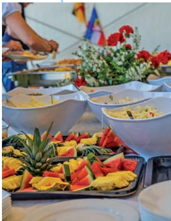
Auch das leibliche Wohl kommt nicht zu kurz – Grillbuffet während der Goldenen Schärpe 2017.