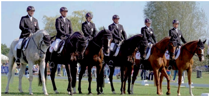
Mannschaftsdressur: Team Austria bei der Ländlichen EM Vielseitigkeit 2015 in Helvoirt (NED).